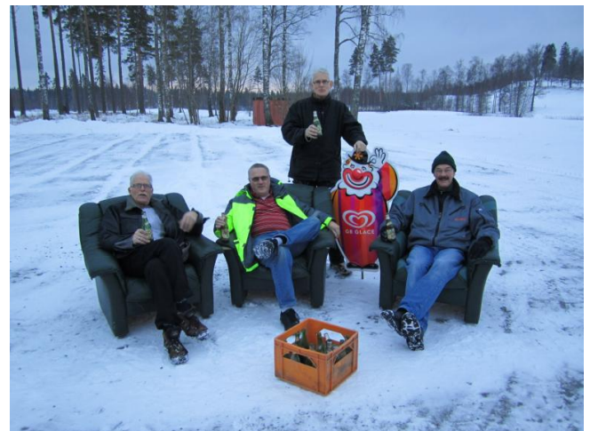
Under året blev en man instängd bakom en vägg och ny uteservering öppnades.