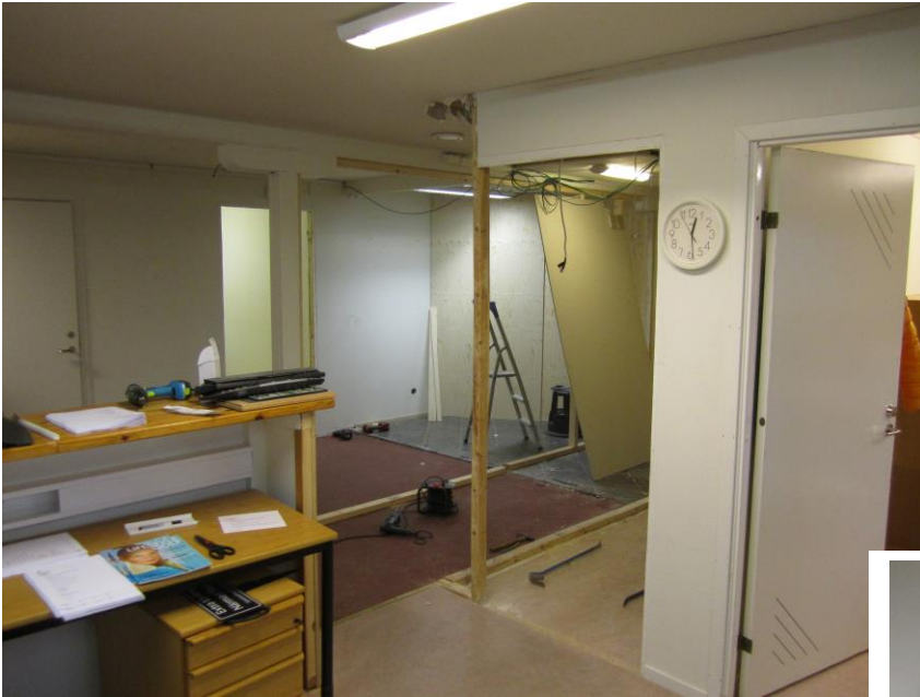
Klubbchefen skulle ha nytt rum.