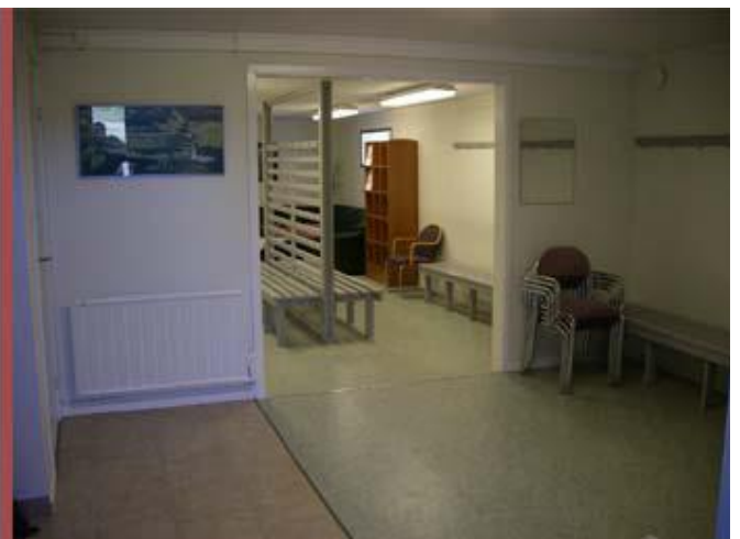
Under vintern 2009-2010 förändrades det till detta.