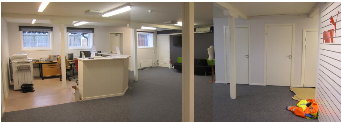
Det blev riktigt fint, det nya kansliet