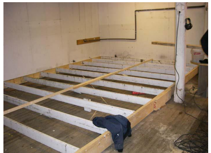
Vi fick göra nytt golv 30 cm högre.