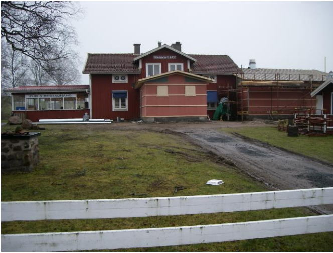
Under år 2009 byggdes köket om.