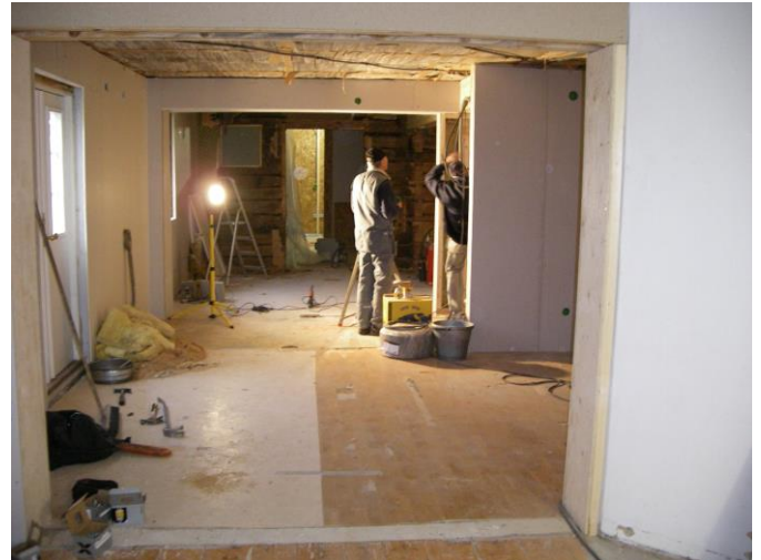
Vi var med och hjälpte till med det vi kunde.