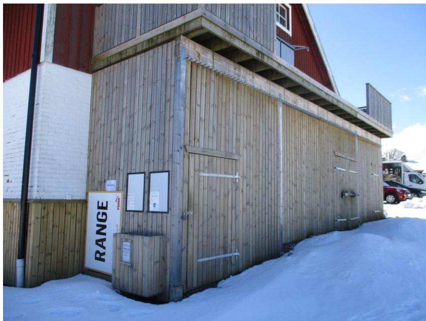
Vi byggde in golfbollsautomaten, och ordnade förråd och plats för inhyrd golfbil.