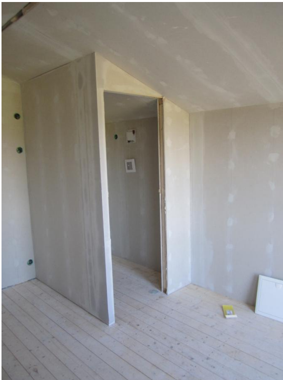
Där vi fixade inredningen.