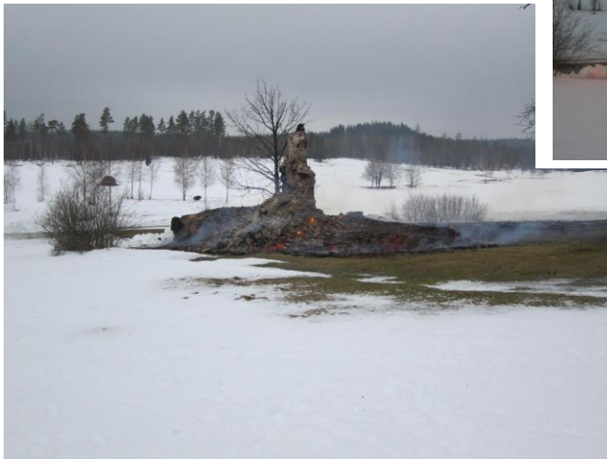
Klockan 11:33 (Otäckt vad fort det går)