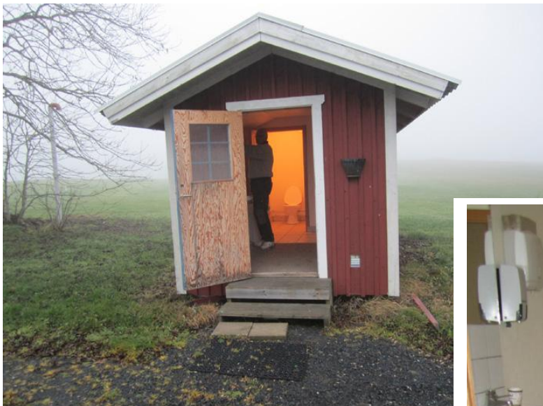
Objekt 2 Toaletten mellan kansli och restaurang.