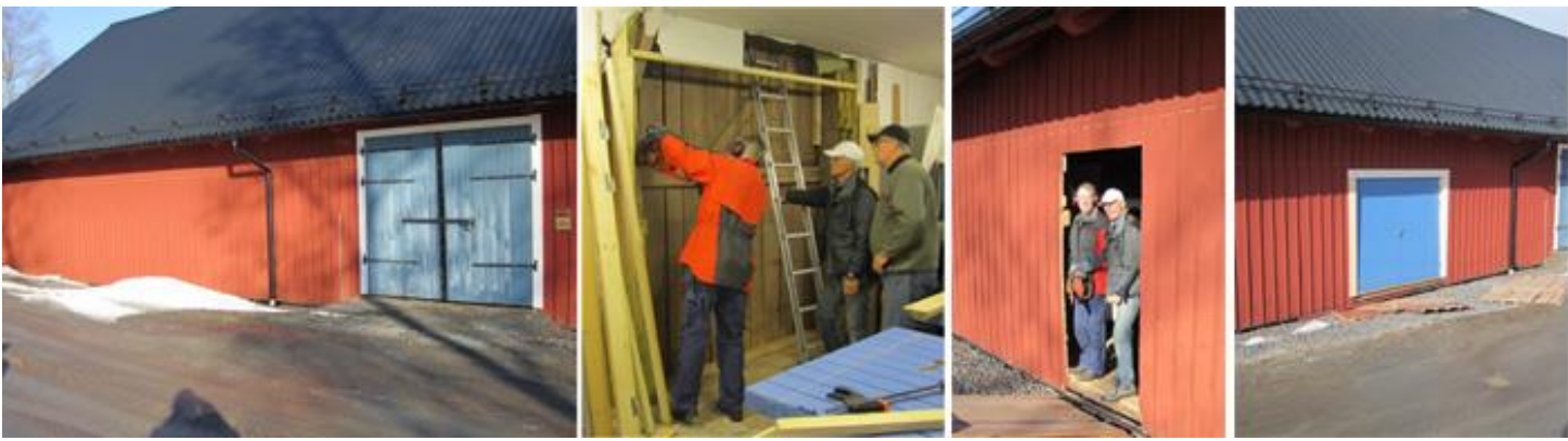
Här gör vi en ny port för blivande golfbilsgarage.