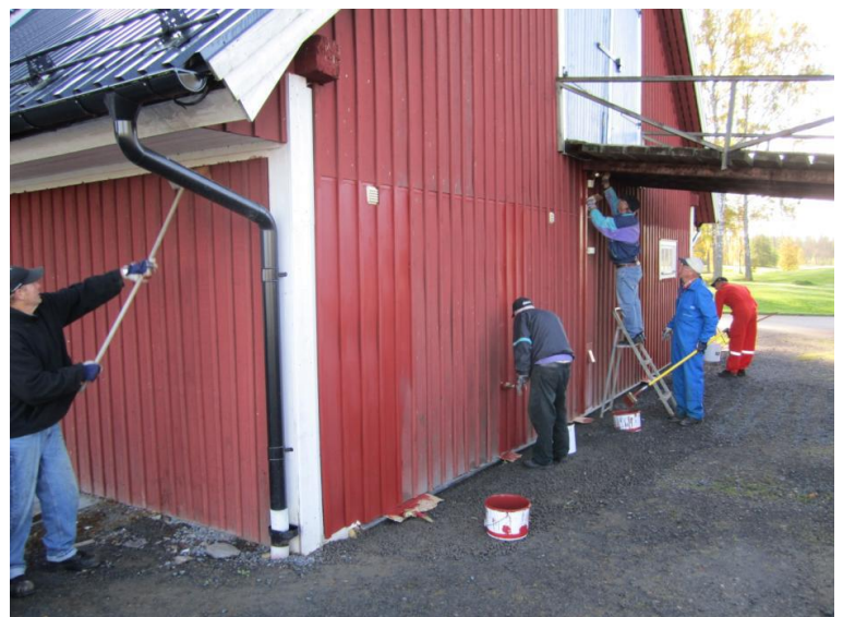
Vi målade även hela "ladan"