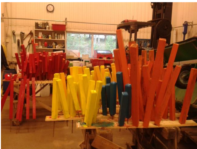
Varje år skall det målas och skapas nya "pinnar".