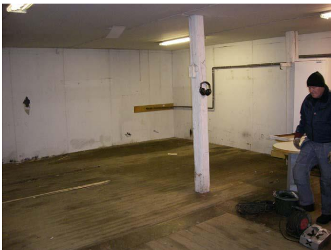
Bakom väggen ligger herrarnas blivande omklädningsrum.