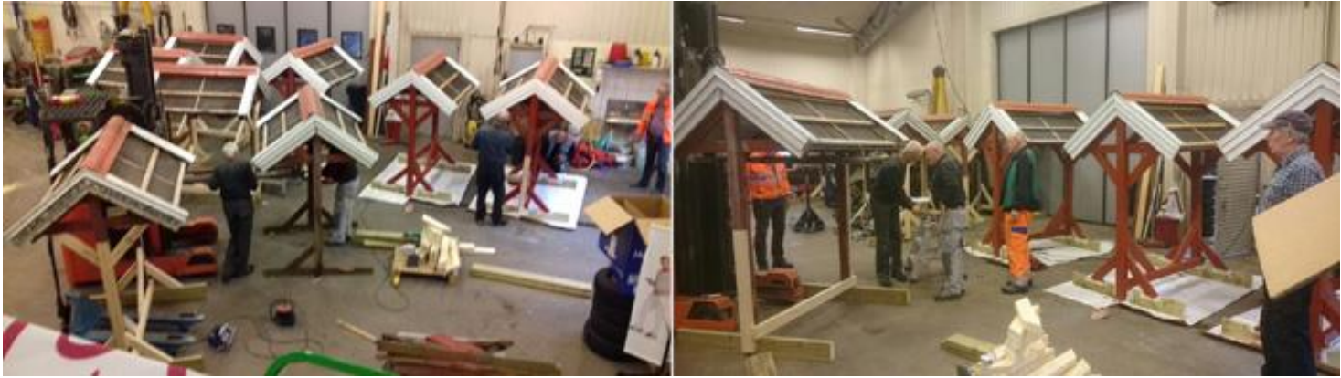
2016 renoverade vi alla "husen" på Ängabanan