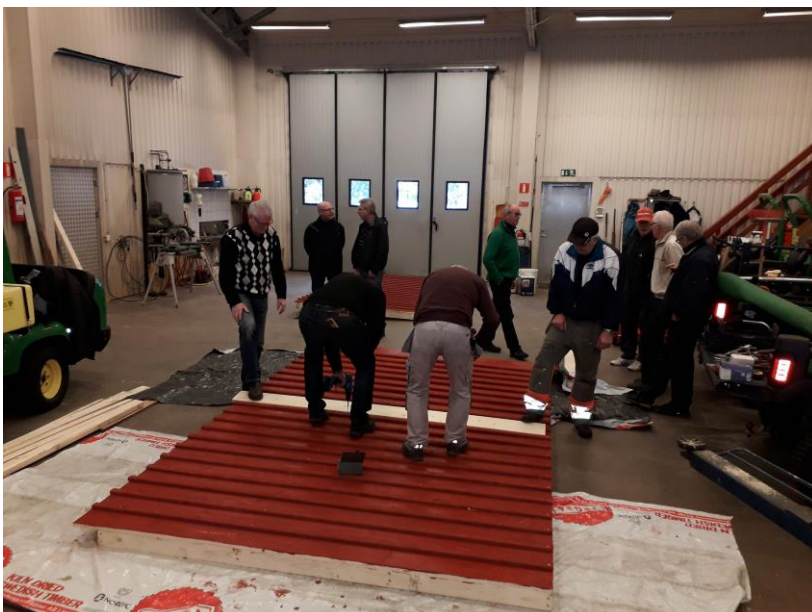
Vintern 2017-2018 gjordes väggar till blivande förråd till restaurangen.