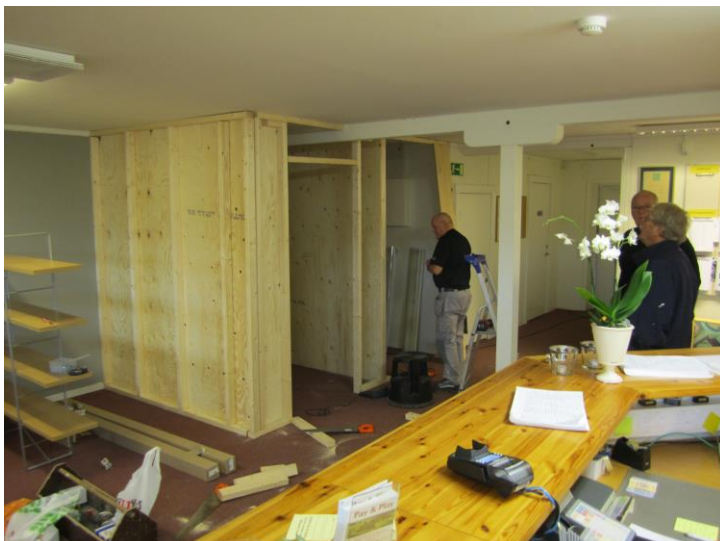
Nytt förråd skulle det bli.