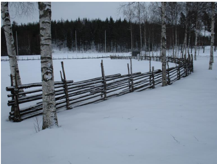
Vi hjälpte till med gårdsgården runt husvagnparkeringen.