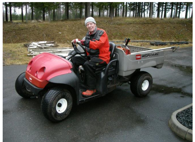
Även röjning av sly och annat sker årligen. 2015-2016