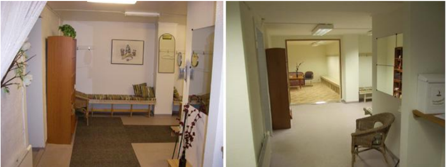
Nu gjorde vi om damernas omklädningsrum. De skulle ju inte ha sämre än herrarna.