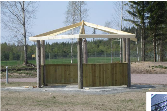
Samma år byggde vi "lusthuset" på husvagnsparkeringen.