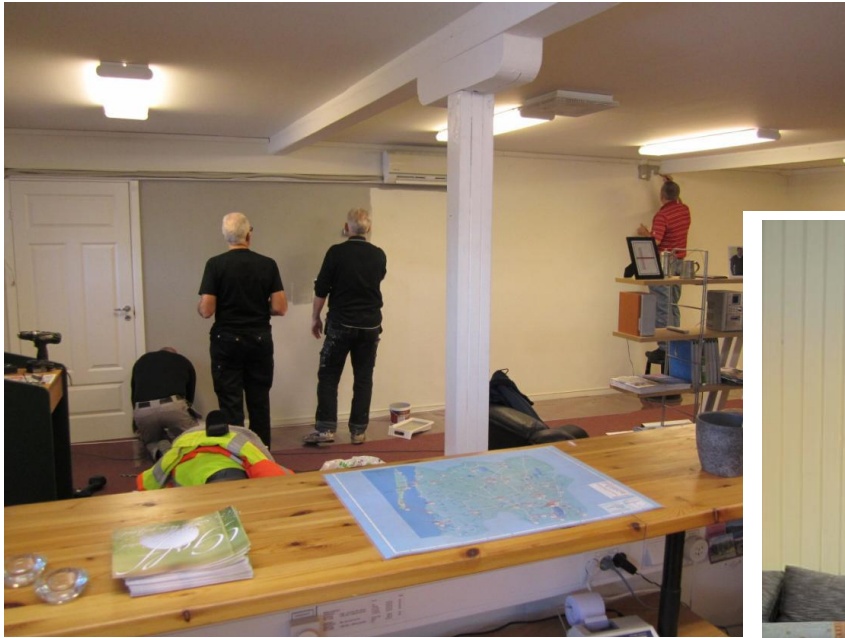
När vi ändå var igång målade vi om väggarna i kansliet och fönsterbrädorna i uterummet i restaurangen.