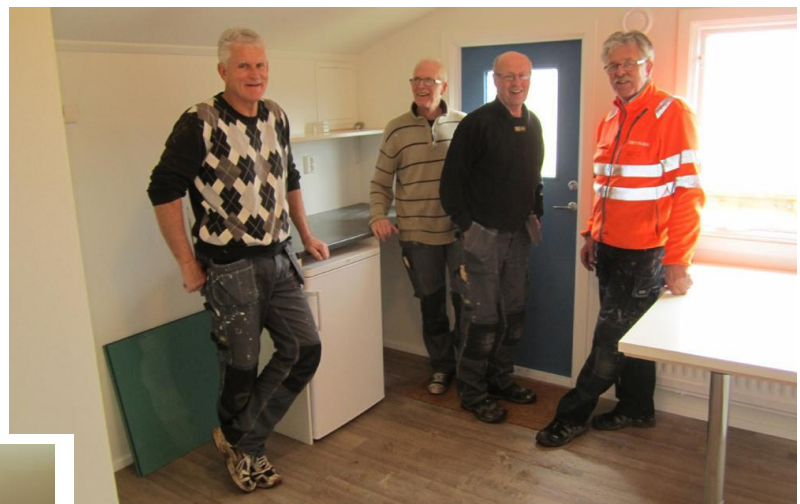
Efter mycket jobb är vi nöjda.