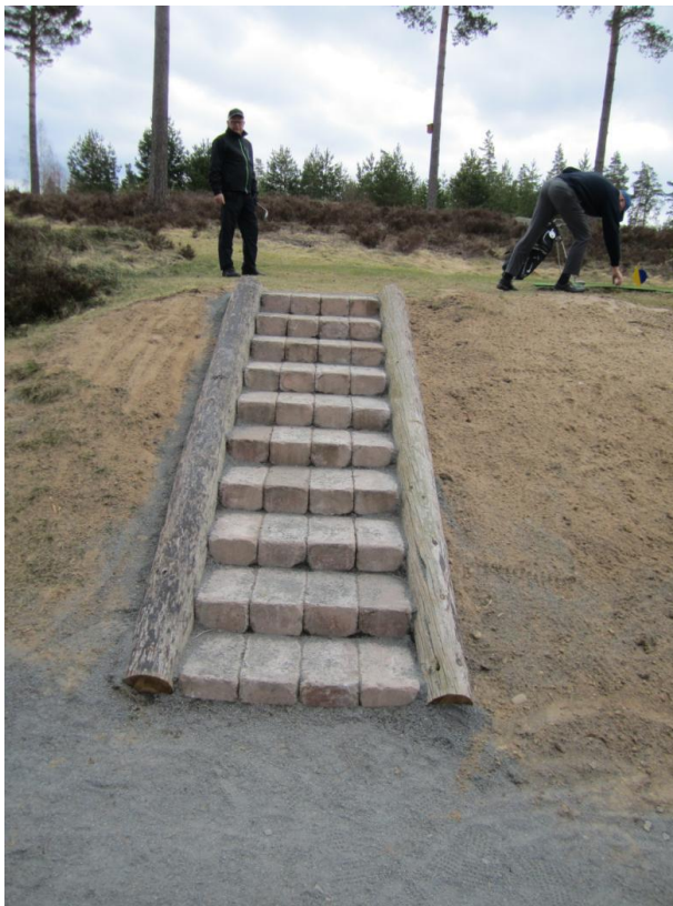
April 2012 gjorde vi trappan vid hål 13.