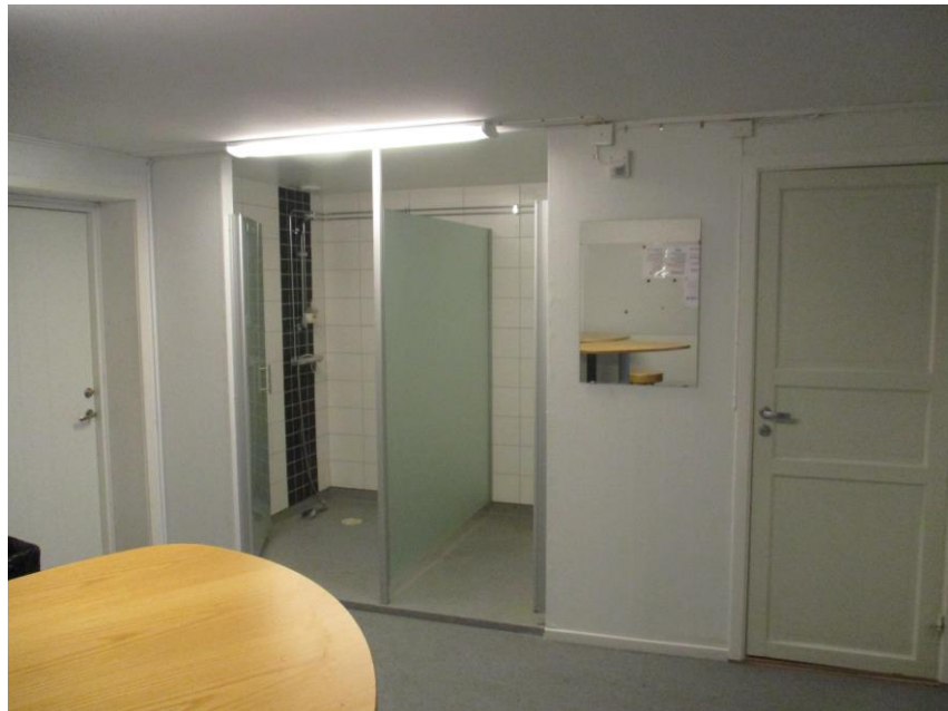
Herrarnas dusch gjorde vi om 2015.