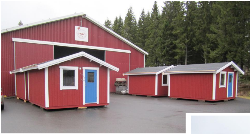
Färdiga "skal" flyttades ut efter hand.