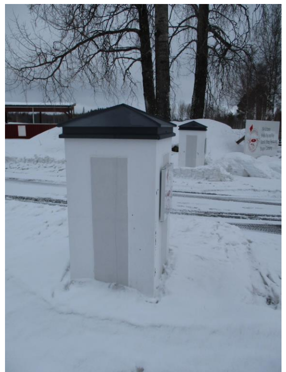
Det gjordes också två fina pelare vid infarten.