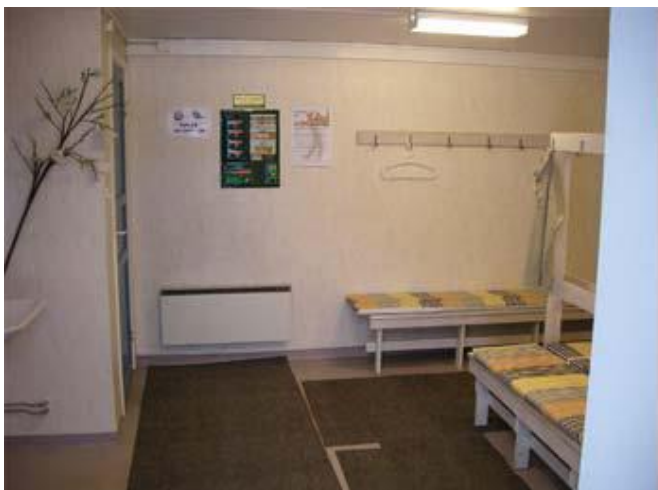
Fram till år 2009 såg herrarnas omklädningsrum ut så här.