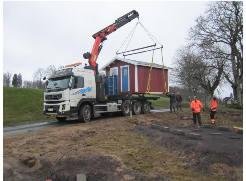
För att med hjälp av Hovslätts buss flyttas på plats.